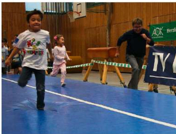
Sichtlich Spaß haben die Kinder auf der Airtrackbahn in der Sporthalle des Beruflichen Schulzentrums.

Teilweise hangelten sich die Mädchen und Buben sogar wie kleine Abenteurer über imaginäre Schluchten. An allen Bewegungsstationen herrschte ununterbrochen Hochbetrieb. Beim Laufparcours mit elektronischer Zeitnahme wurden über 1000 Läufe absolviert. Dabei versuchten die Kinder, ihre eigene gelaufene Zeit ständig zu verbessern. Eine weitere Attraktion war die Airtrackbahn, eine überdimensionale Luftmatratze, bei der es immer wieder lange Warteschlangen gab. Auf die Frage, was gefällt euch am besten, antworteten die 8-jährigen