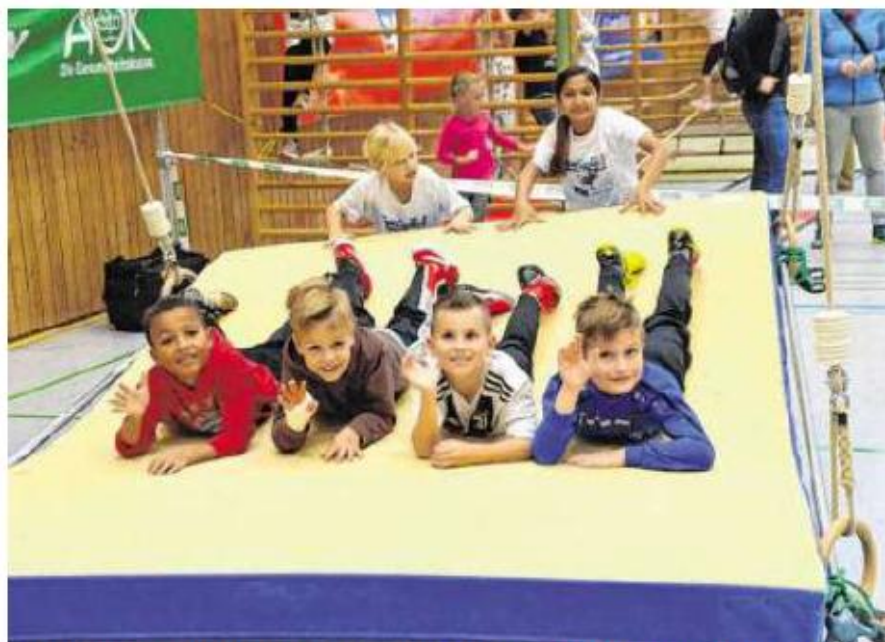
Sie hatten ihren Spaß: Beim Programm „SpoSpiTo“ war in Kempten für Kinder wieder einiges geboten.