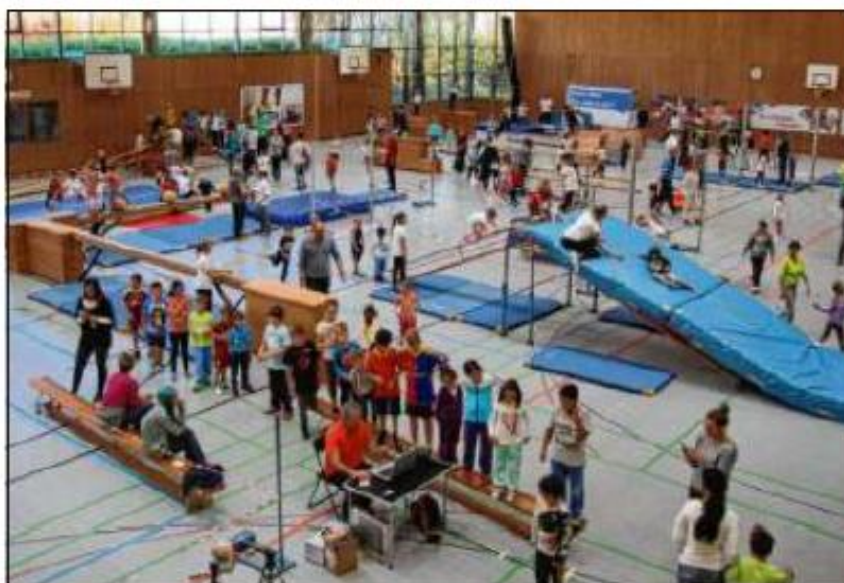
Hier können die Kinder sich austoben und Spaß haben – bei den Aktionstagen werden große Parcours in den Sporthallen aufgebaut.

Termine in Memmingen, Kempten, Sonthofen und Kaufbeuren