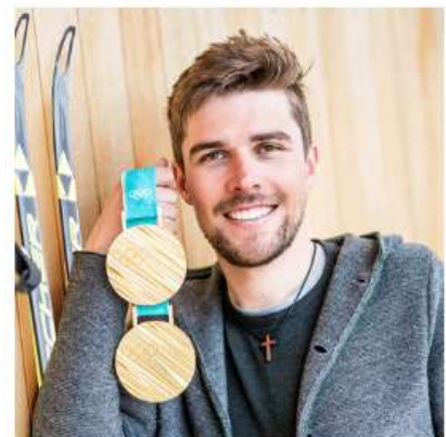
Der erfolgreiche Nordische Kombinierer Johannes Rydzek ist Pate der Allgäuer Tobetage.