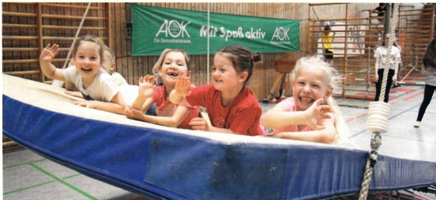
Ein Teil der Abenteuerlandschaft und großer Anziehungspunkt: die Riesenschaukel.

87435 Kempten. Hier wird für Kinder im Alter von vier bis zehn Jahren ein Bewegungs- und Spieleparcours mit Großgeräten aufgebaut, so dass eine attraktive Abenteuerlandschaft entsteht. Den Kindern werden vielfältige Bewegungsmöglichkeiten wie Klettern, Springen, Schaukeln, Schwingen, Rollen, Balancieren und vieles mehr angeboten. So können die Kinder ihrem natürlichen Bewegungsdrang freien Lauf lassen – eben „Sporteln, Spielen, Toben“! Betreut werden die Kinder während der Veranstaltung durch Übungsleiter und Helfer des TV Kempten, der Eintritt kostet pro Kind 4 Euro.