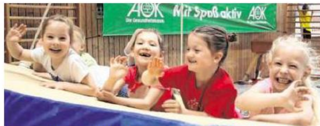
Gute Laune ist beim Kinderaktionstag am Sonntag im Beruflichen Schulzentrum Kempten garantiert.

Es werden wieder mindestens 400 junge Gäste erwartet, die sich nach Herzenslust an den zahlreichen Stationen austoben. Mitglied im TV Kempten müssen die Kinder dafür nicht sein, Sportkleidung und Sportschuhe sollten sie selbst mitbringen. Nach der Teilnahme erhält jedes Kind eine Urkunde. Diese stellt zugleich einen Gutschein für zwei Stunden in der Badewelt im Cambomare dar, gültig bis einschließlich 3. November. Da die Teilnehmerzahl an der Veranstaltung begrenzt ist, haben angemeldete Kinder Vorrang. (tga)