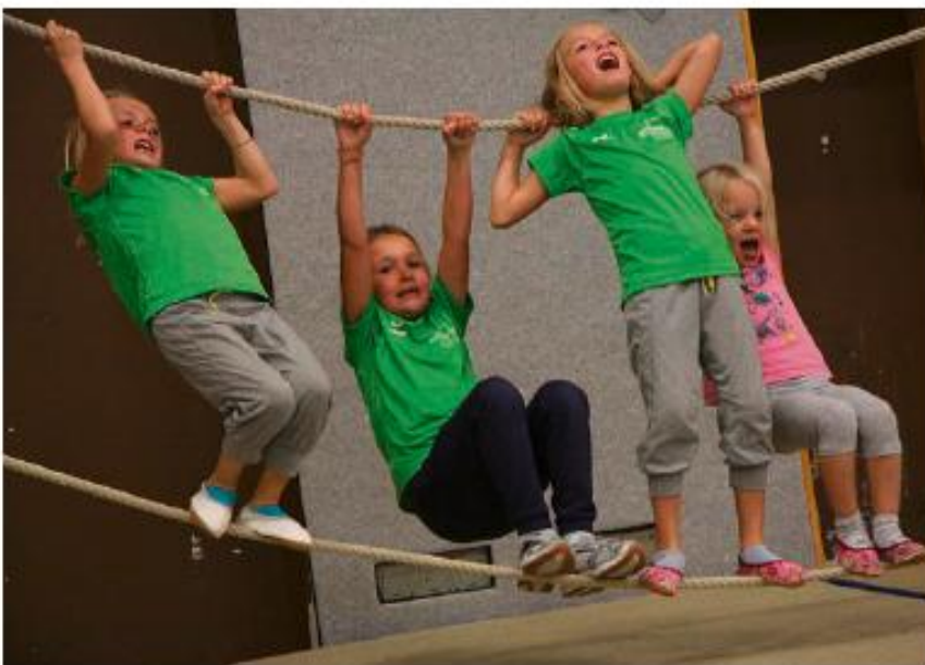
Schaukeln wie ein Affe heißt es an dieser Station.

Nach der Teilnahme erhält jedes Kind eine Urkunde. Diese stellt zugleich einen Gutschein für zwei Stunden in der Badewelt im Cambo Mare dar, gültig bis einschließlich Samstag, 3. November. Da die Teilnehmerzahl begrenzt ist, haben angemeldete Kinder Vorrang. Registrierung im Internet unter www.spospito.de .